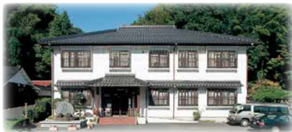
本社(石見銀山資料館隣り)

〒694-0305 島根県大田市大森町ハ132 TEL：0854-89-0231(代) FAX：0854-89-0018 http://www.nakamura-brace.co.jp e-mail：nakamura@nakamura-brace.co.jp ※大森町は世界遺産「石見銀山」の町です。