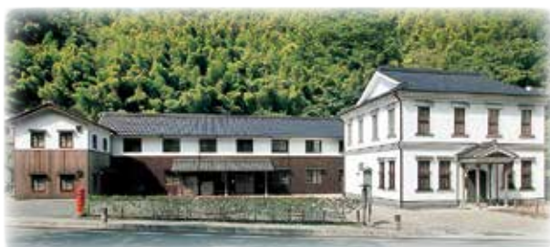
メディカルアート研究所