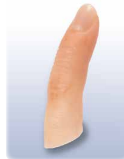
手指(マニキュア用爪付)