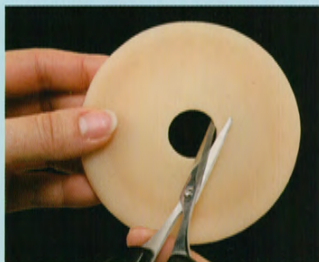
注) カットできるのは635Nのみ